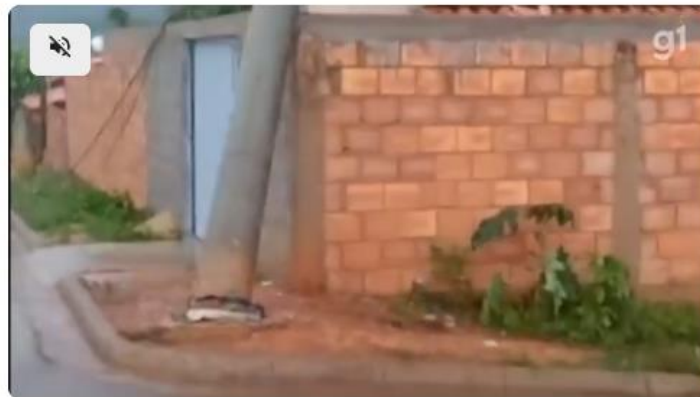
VÍDEO: Chuva danifica rede elétrica em Dom Bosco

Fonte: https://g1.globo.com/mg/grande-minas/noticia/2026/01/13/tempestade-com-granizo-derruba-postes-e-provoca-estragos-em-dom-bosco.ghtml