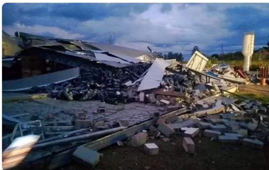
Galpão de empresa desabou após chuva forte em Minduri, MG