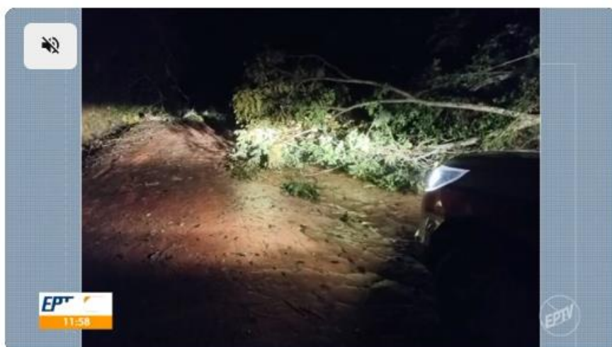
Chuva forte deixa prejuízos no Sul de Minas; veja balanço do temporal na região.

10/06/2025 08h01 · Atualizado há 2 meses