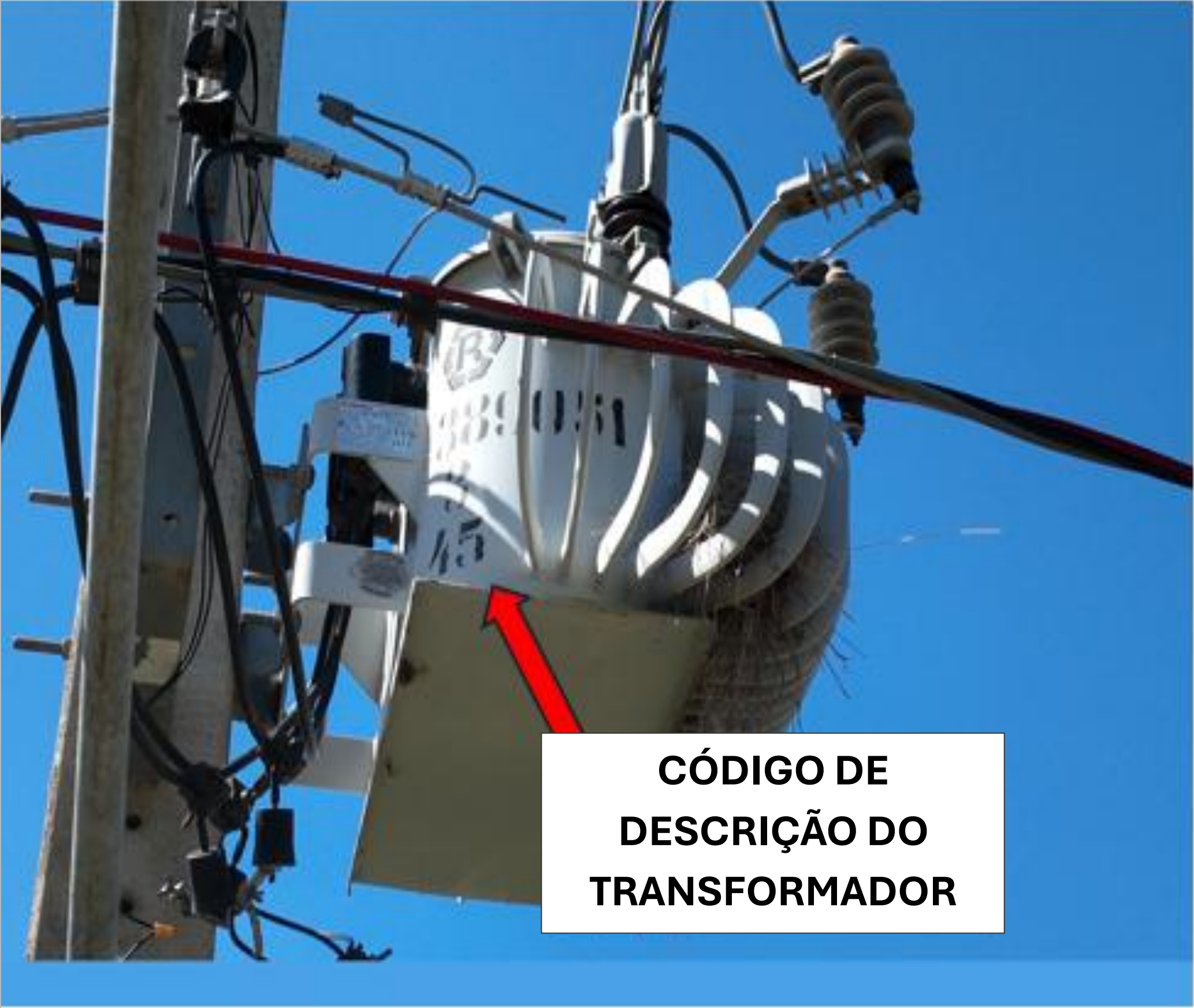
Figura 2 - Código de descrição do transformador