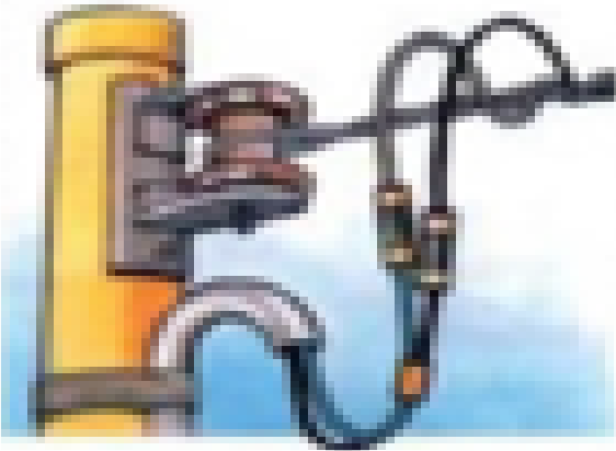
REDE MONOFÁSICA LIGAÇÃO A 2 FIOS