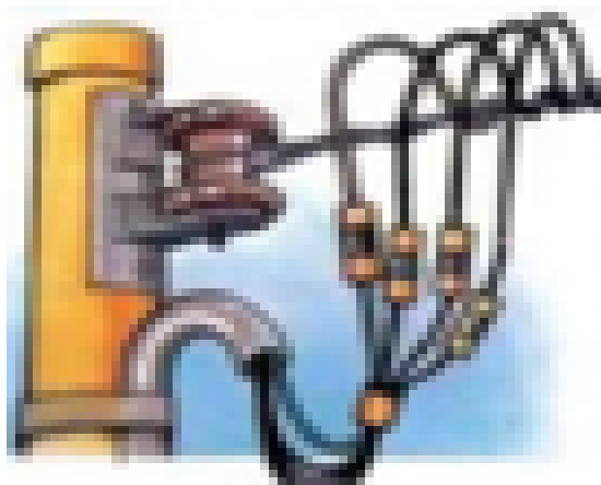
REDE TRIFÁSICA LIGAÇÃO A 4 FIOS