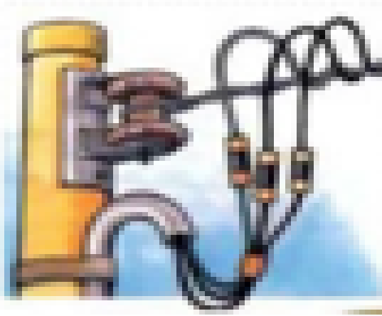
Rede Bifásica Ligação a 3 fios