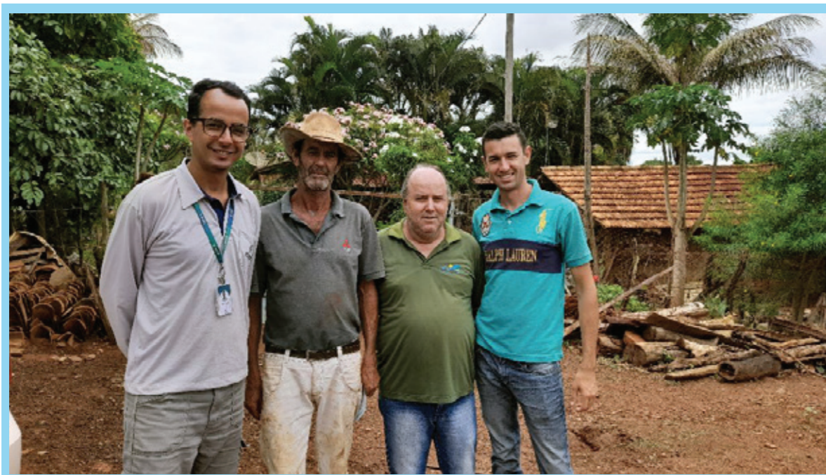
Entrevista com representantes da comunidade do município de Três Ranchos, GO