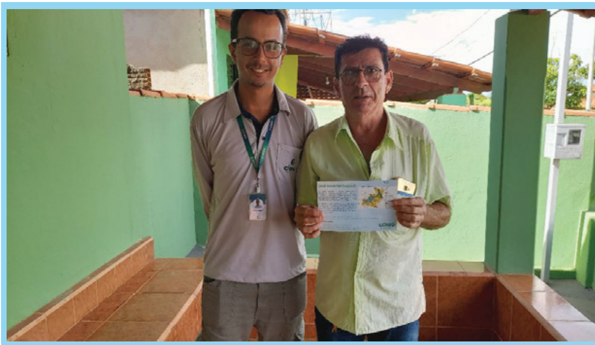
Entrevista com representante da Secretaria Municipal de Meio Ambiente do município de Grupiara, MG

A pesquisa mostrou também o interesse dos entrevistados em participar de reuniões periódicas em formato online. A primeira reunião dos Comitês de Gerenciamento Participativo aconteceu em março de 2023, para a apresentação e esclarecimento de dúvidas sobre o PACUERA e o Programa de Gerenciamento Participativo e para receber as indicações de nomes que iriam compor os Comitês Gestores. Na ocasião, também foi apresentado o software interativo online com exposição do zoneamento proposto pelo PACUERA.