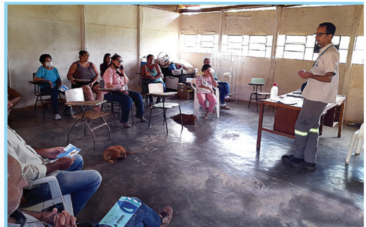
Entrevista com representantes da comunidade, Catalão, GO