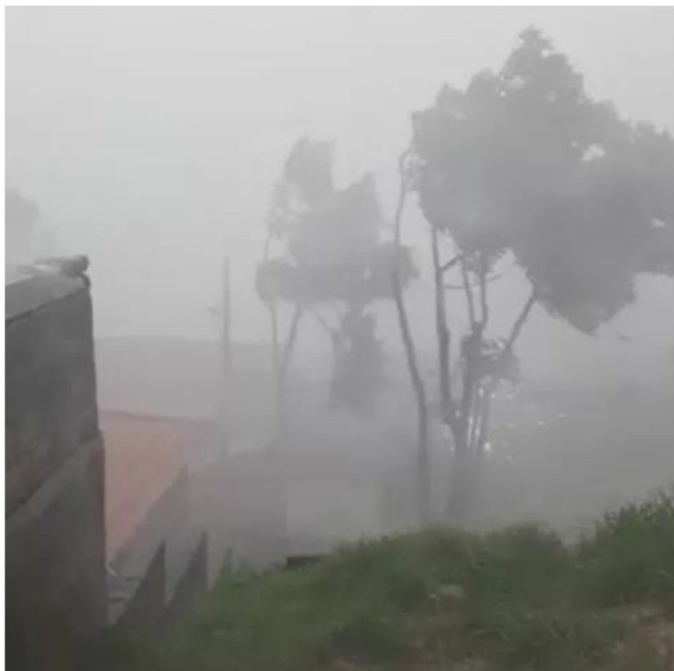
Temporal derruba árvores, destelha casas e deixa moradores desalojados em Campestre, MG

Em nota, a Companhia Energética de Minas Gerais (Cemig) informou que a maior parte das ocorrências foi provocada por queda de árvores, postes, galhos e outros objetos que, com a força do vento, foram lançados sobre a rede elétrica. A companhia também informou que trabalha para normalizar o fornecimento de energia o mais rápido possível.