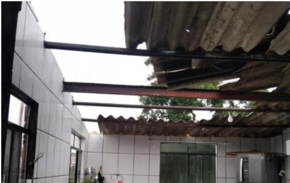
Temporal derruba árvores, destelha casas e deixa moradores desalojados em Campestre, MG