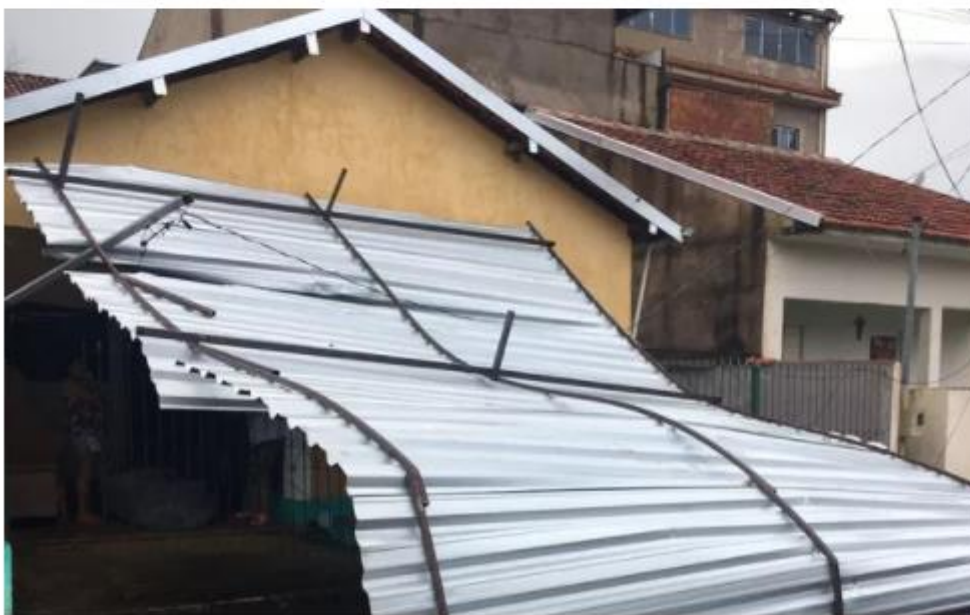
Temporal derruba árvores, destelha casas e deixa moradores desalojados em Campestre, MG