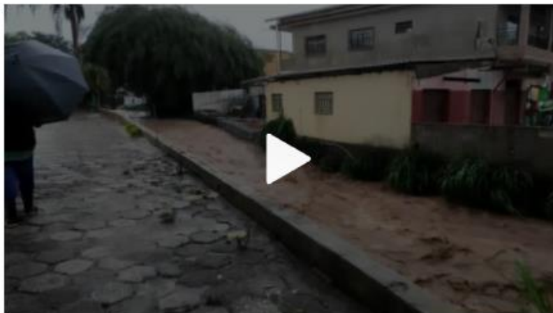
Nível do Rio Maracujá assustou moradores logo no início da tempestade

19/10/2021 03h53 · Atualizado há 2 meses