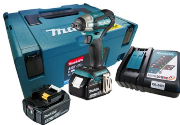
Figura 3: Aplicador de conectores cunha para chave de impacto

Gerência de Processos Especiais de Expansão e Manutenção de Média e Baixa Tensão - EM/PE.