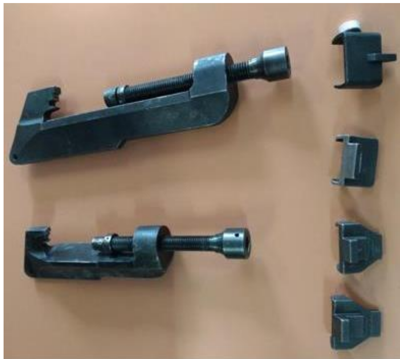
Figura 1: Aplicador de conectores cunha para chave de impacto

A Gerência de Engenharia, Automação e Sistema da Distribuição – ED/ES – comunica a padronização de ferramenta denominada Aplicador de conectores cunha para chave de impacto , sua finalidade é para aplicação e retirada de toda a faixa de conectores cunha do tipo “Ampactão” utilizados na Cemig, ou seja, conectores da série vermelha, azul e amarela.