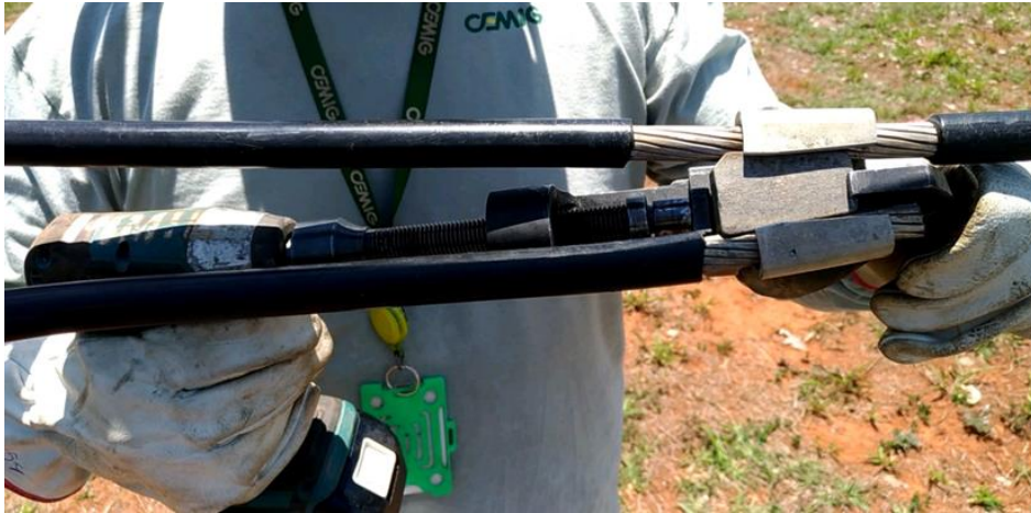
Figura 2: Foto do teste do aplicador de conectores cunha para chave de impacto.